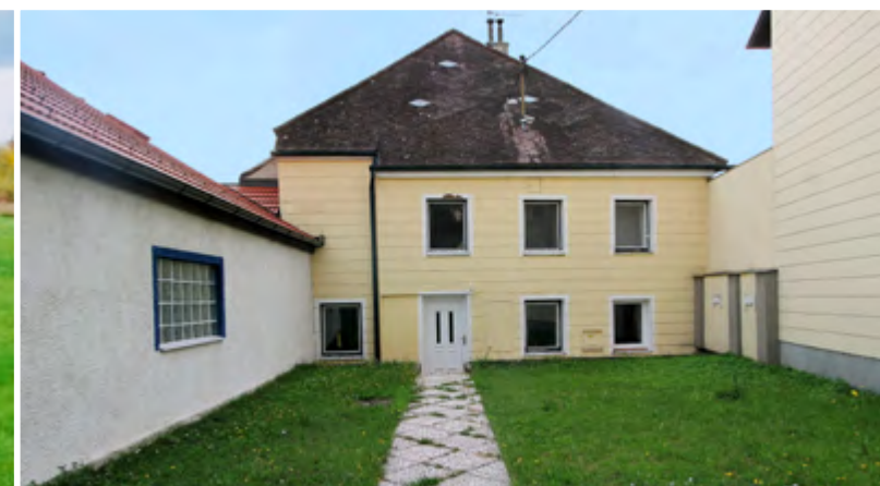
2225 Zistersdorf Baugrund mit Altbestand ca. 400 m 2