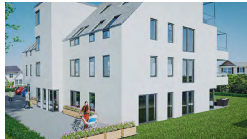
1210 Wien Eigentumswohnungen (Erstbezug) ca. 87 m 2 bis 107 m 2 mit Balkon bzw. Terrasse