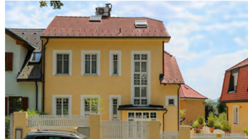
1140 Wien Villa Grundstück ca. 210 m 2 ca. 232 m 2