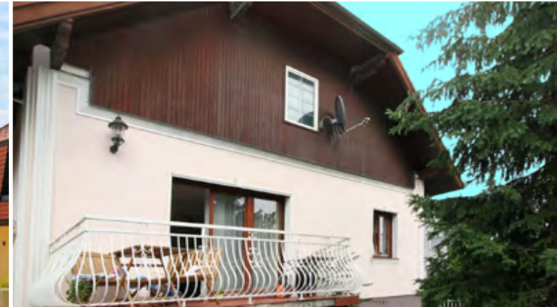
1220 Wien Einfamilienhaus Grundstück ca. 230 m 2 ca. 512 m 2