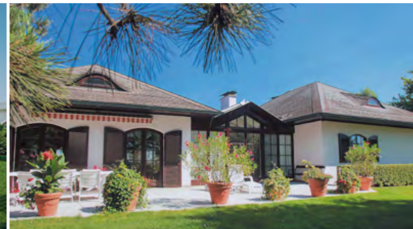
2305 Witzelsdorf Bungalow Grundstück ca. 275 m 2 ca. 2.740 m 2